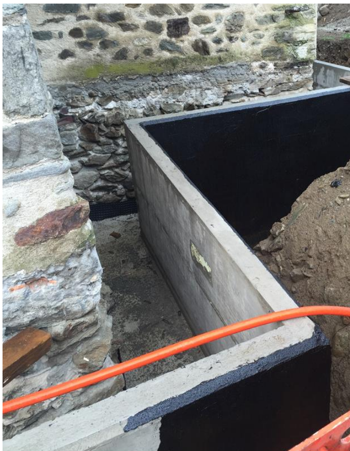
Esecuzione del cavedio perimetrale

Siamo volentieri a disposizione per ulteriori informazioni e vi invitiamo a consultare il sito internet www.sanmamete.ch