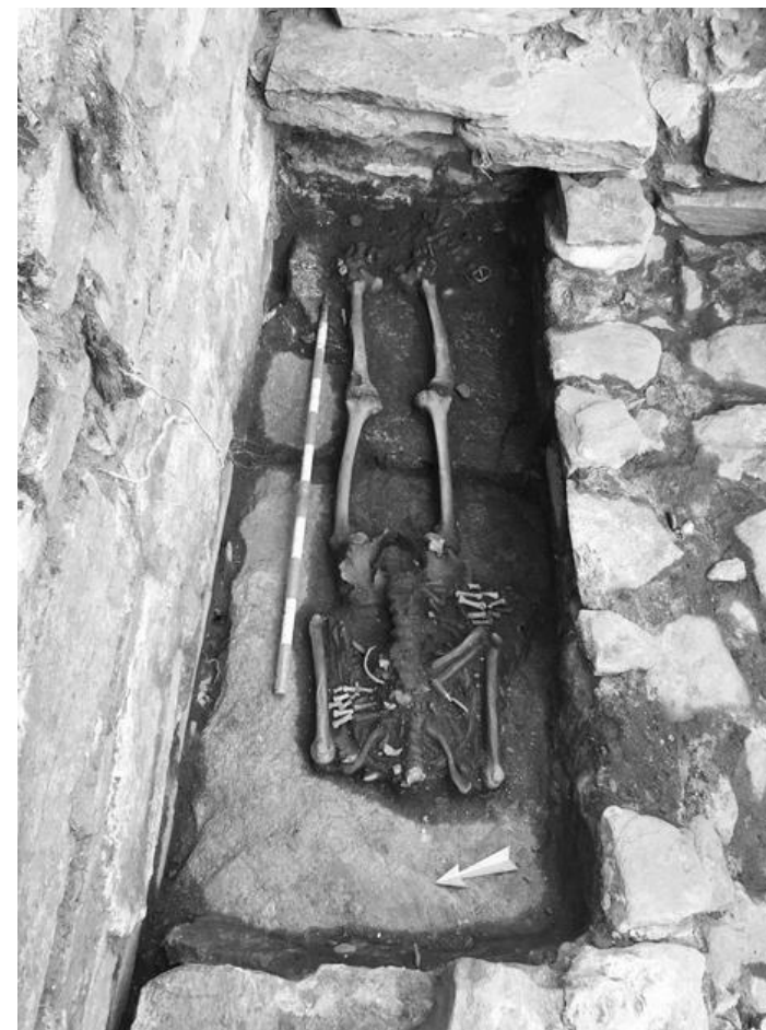
Durante gli scavi per l'esecuzione dei drenaggi perimetrali, sono state ritrovate diverse sepolture d'epoca medievale